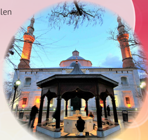
Bursa Yeşil Camii

Ve büyük bir sır saklı çinilerinin gizeminde, zulmü zalimin boynuna dolamış kısa bir beytinde.